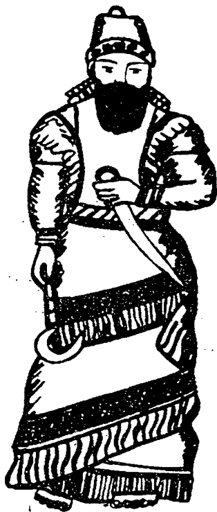
ناسور نازير پال فهرمانره‌وای ناسور