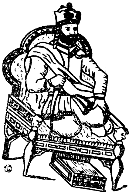
که یقوبادی کورد