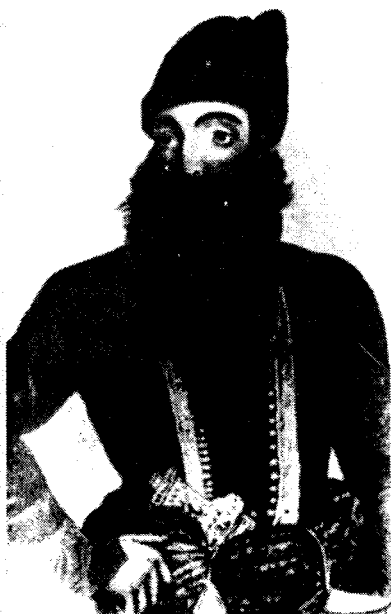
عباس میرزای وهلیعههد