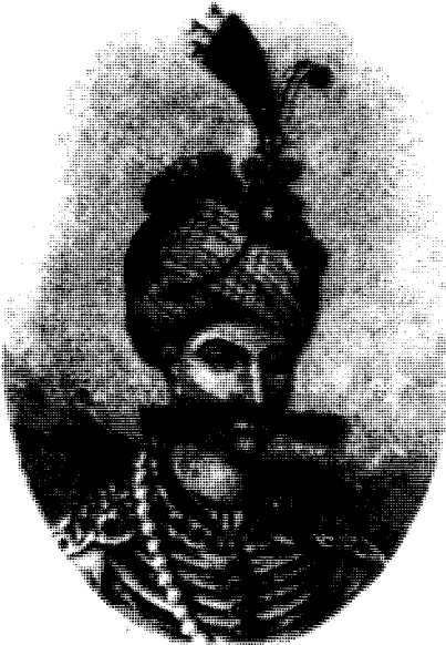
شا عباسی سہ فہوی