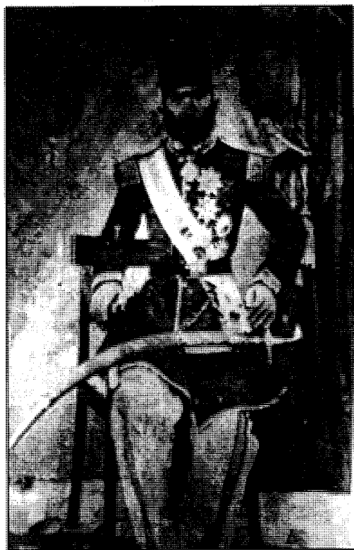
حاجی یوسف خان (شوجاعولدهولہ)