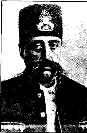
موزه فهره دین شای قاجار