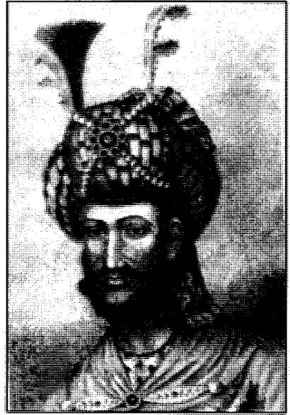
شا ئیسماعیلی سہ فہوی