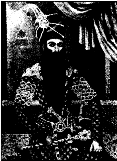
فہتخ علی شای قاجار