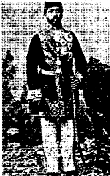
میرزا حسهین خان (سویا سالار)