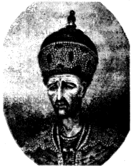
ناغا محمہد خانی قاجار