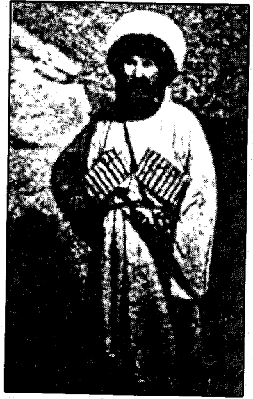
شیخ شامیل (رابه‌ری رزگار یخوازی داغستان)