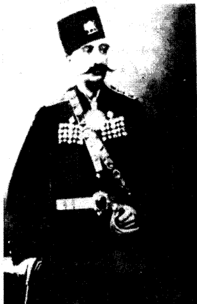
ناسرودین شای قاجار