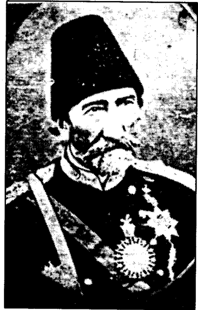
میرزا نیزیامی گه روس