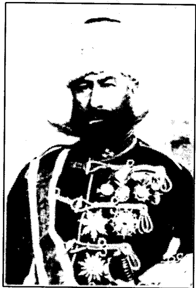
زه نرال واگنهر- ی نه مساوی