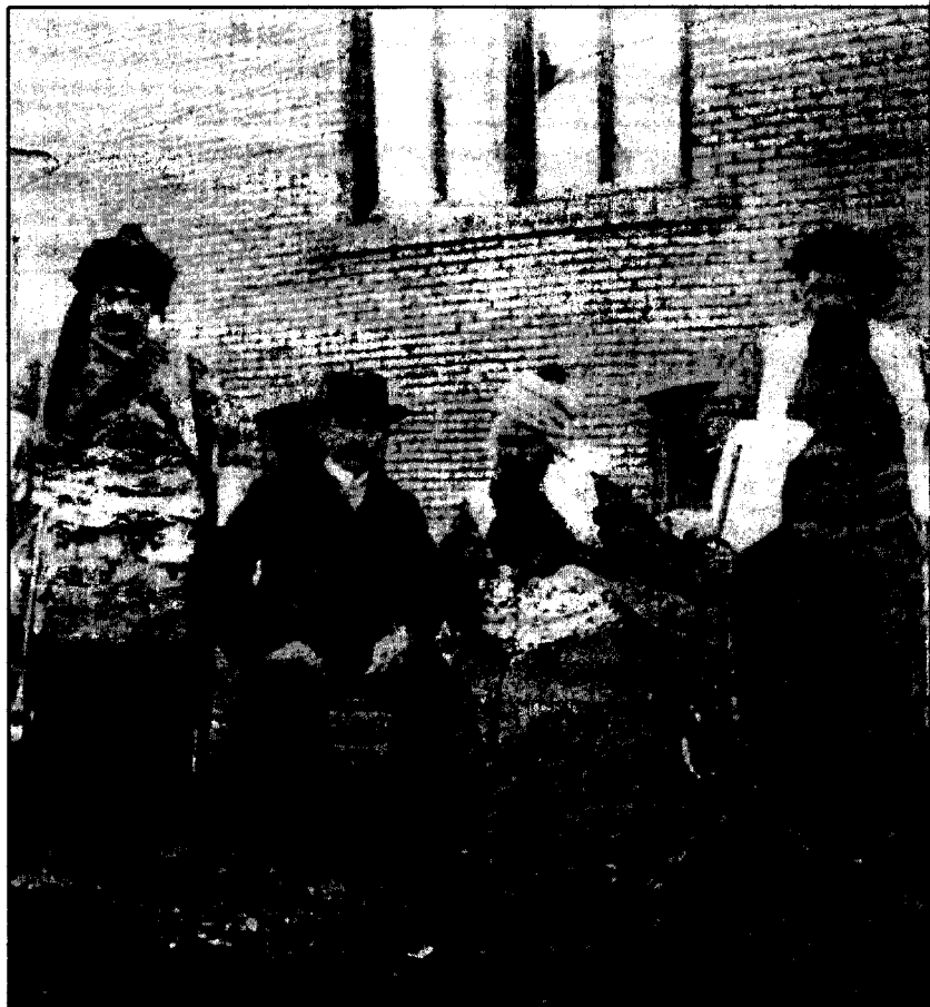
شیخ عہدولقادی کوری شیخ عوبہیدوللای نہہری لہ گہل «دکتور کوچران» ی پزشکی مسیونیری دستہی نہمریکایی و دوو پیشمہرگہ بہ «پیٹوہ و ہستاون» لہ شاری ورمج، لہ سالی ۱۸۸۰ دا