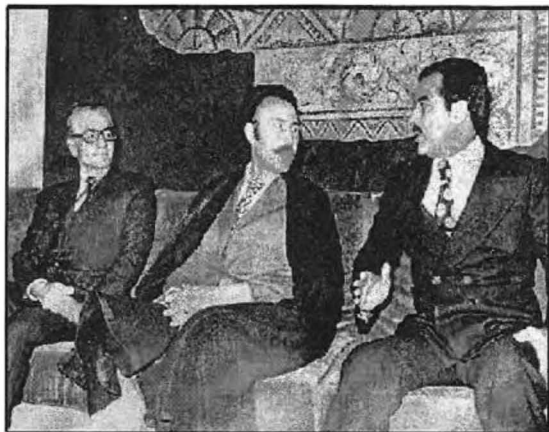
سەھام ھوسەين ——— شەھزادە ئۆمىيەت ——— شا