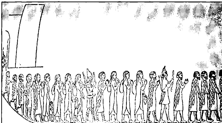
به ززر کۆچاندنی ماده کان، له پرووی بهردیکی تاشوورییه کان له نهینهوا کیشراوه، سه دهی حهوتهمی پیش زاین