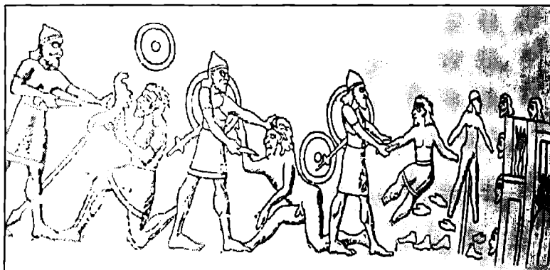
تاشوورییه کان دیله کان ده کوژن- له پرووی نه خشی ده رازدی (بالارات) ی شه لمانشاری سینه م وهر گپراوه.. له سه دهی نۆیه می پیش زایندا