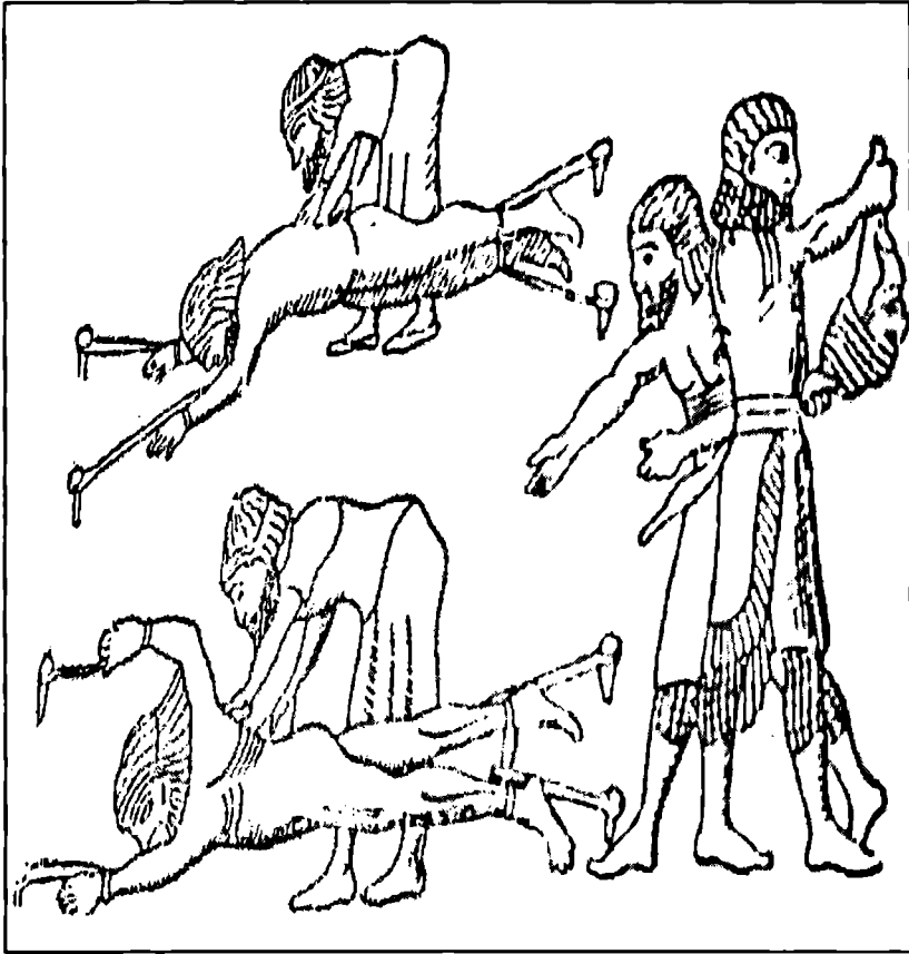
نه شکه نجه دانی پیشهوا گیراوه کان، که دژی ناشوریه کان وه ستاونه ته وه له نه یینهوا نه خشکراوه. (سده هی حه و ته می) پیش زاین